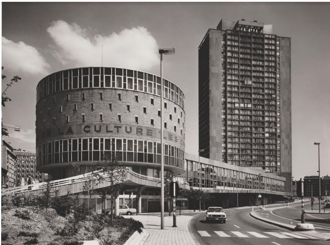
Complexe des Chiroux-Croisiers

Le dimanche 17/10, dernier jour de l'exposition, vous êtes convié.e.s aux festivités de finissage, avec notamment un débat-conférence autour de l'avenir du quartier Chiroux-Croisiers (intervenants, titre et heure exacte à confirmer). Actualités et informations sur www.chiroux.be