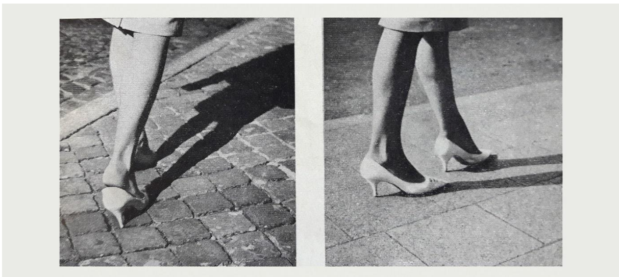
Photographies anonymes publiées dans Jean Lejeune, L'avenir de Liège et les travaux publics , vers 1965.